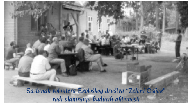
Sastanak volontera Ekološkog društva "Zeleni Osijek" radi planiranja budućih aktivnosti